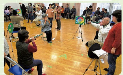
城北地区高齢者交流会