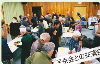
子供会との交流会