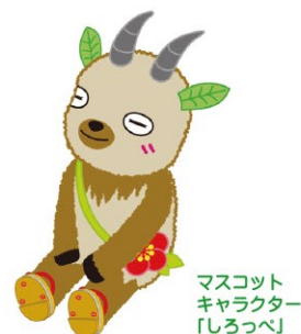
マスコット キャラクター 「しろっぺ」

すごいスピードで苗を植えていく田植え機を興味津津見つめていたら、あっという間に終えてしまいました。秋祭りの頃には穂に実をつけて私たちの食卓に上ります。1年がかりで実ってくれるお米に感謝しながらいただきます。