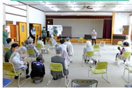
東部ふくしあから出張講座