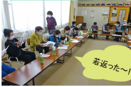
下西郷西いきいきサロン