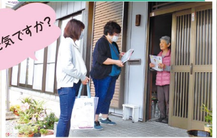
北門いきいきサロン