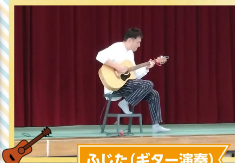
ふじた(ギター演奏)