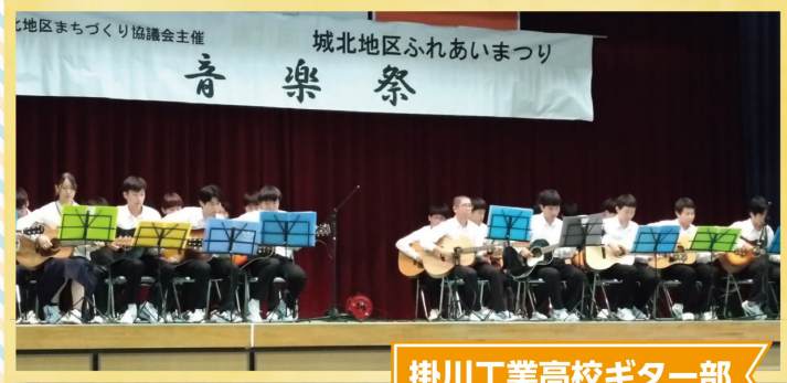
掛川工業高校ギター部