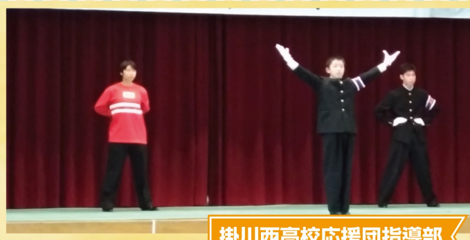
掛川西高校応援団指導部