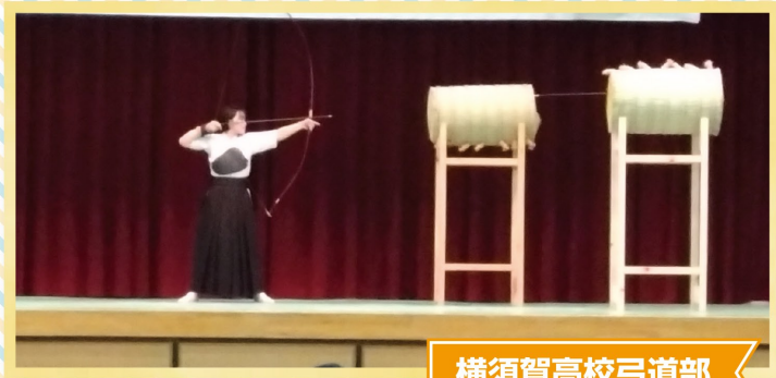
横須賀高校弓道部

今年も音楽祭が地区民の出演、北中学校吹奏楽部などの演奏が盛大に行われました。特別企画として掛川市内の高等学校4校が演奏や演武披露なども行いました。クイズや抽選会も行われました。