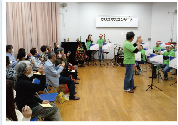
第6回 クリスマスコンサート 12/10

今回のしろきたスクールでは、料理教室と音楽鑑賞を行いました。日々の生活に役立つことを学んだり、様々な楽器のアンサンブルを楽しんだりととても有意義な回となりました。