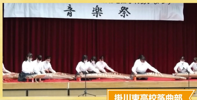
掛川東高校箏曲部