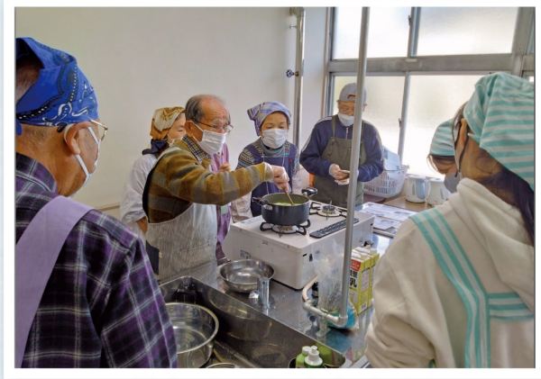
第5回 料理教室 11/25