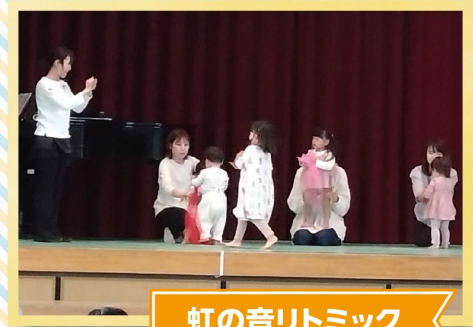
虹の音リトミック