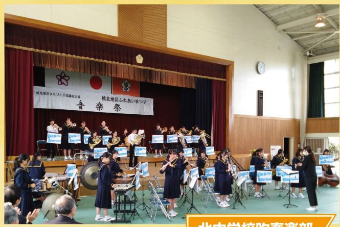
北中学校吹奏楽部