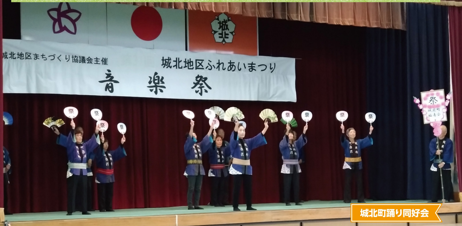
城北町踊り同好会

今年で32回を迎えた「ふれあいまつり」が、前年に続きアート作品展と音楽祭を開催日を分散して行われました。今号ではその模様を特集してお届けします。(次ページに続きます) なお、音楽祭の様子は城北まち協のYouTubeチャンネルからご覧いただけます。参加した方も参加できなかった方もぜひご覧ください。